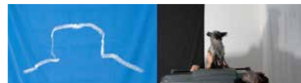
Pinceau du peintre, 2023