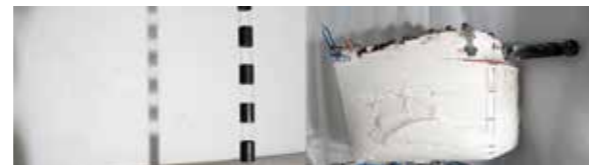
Progéniteur ?, 2024

Florian Fouché utilise des éléments de mobilier urbain qui évoquent les obstacles rencontrés par les personnes en fauteuil dans l'espace public.