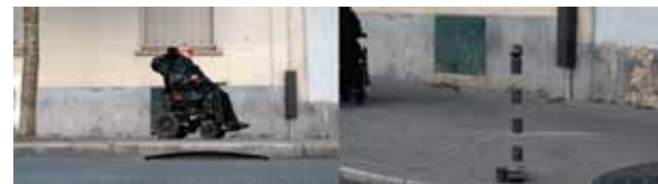
Sculpture non déclarée, 2023-2024