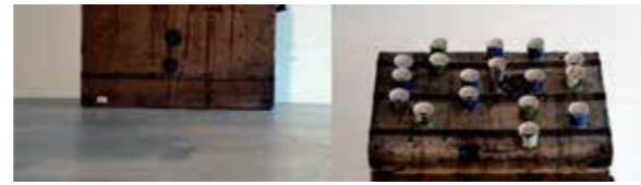
Tous ceux que j'aurais pu aider, 2023-2024

Dans le film, chaque sculpture s'anime et raconte une histoire, elles se transforment en personnage. Les voir «en vrai» dans leur matérialité, nous rapproche d'elles.