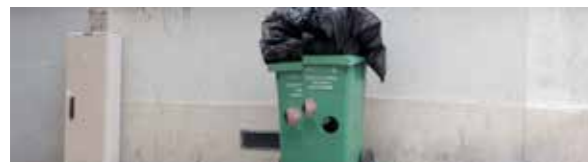
10 rue Saint-Luc 75018 Paris, 2024