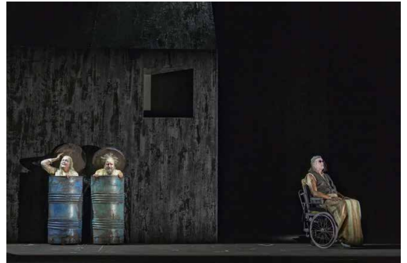
« Fin de partie », mise en scène par György Kurtág, d'après l'œuvre de Samuel Beckett.

Florian Fouché filme en « CAMÉRA BIGLE ». Il s'agit de filmer avec deux caméras simultanément en cherchant l'hétérogénéité de points de vue qui oscillent entre divergence et convergence. Les caméras sont fixes et/ou mobiles, accrochées à des accessoires, du mobilier urbain, et à des corps en mouvement.