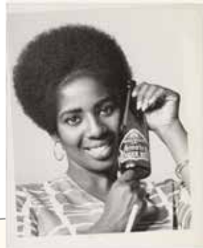
Publicité pour la bière Jamaica Ginger Beer (Bière)