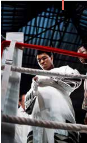
Reportage sur le combat de boxe avec Muhammad Ali et George Foreman en 1974.

Un photographe professionnel est payé pour faire des reportages photographiques et des publicités .