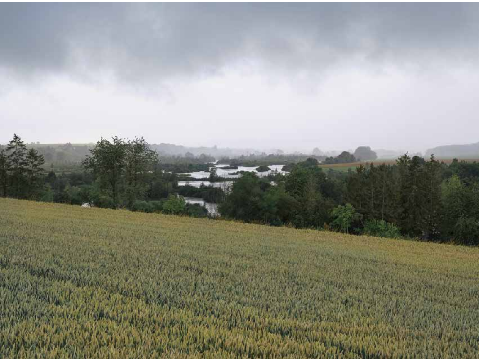
Frise Vallée de la Somme