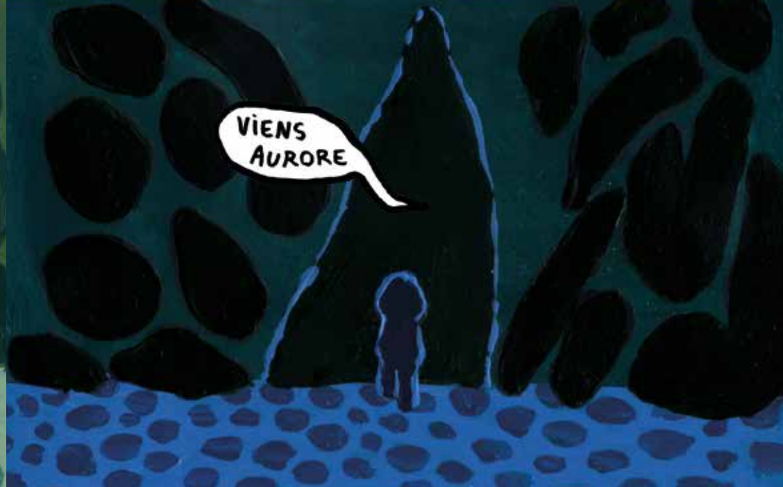
Elle s'installe et attend tranquillement qu'on lui fasse signe.