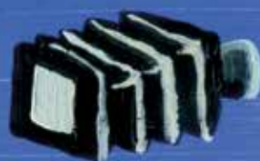
La chambre photo