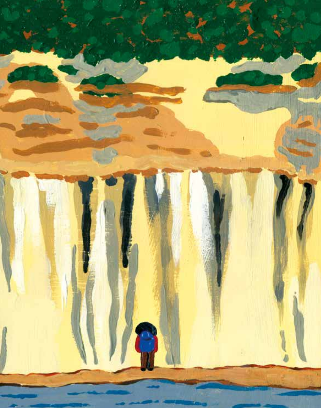
Aurore contemple les roches.