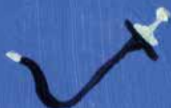
Le déclencheur souple