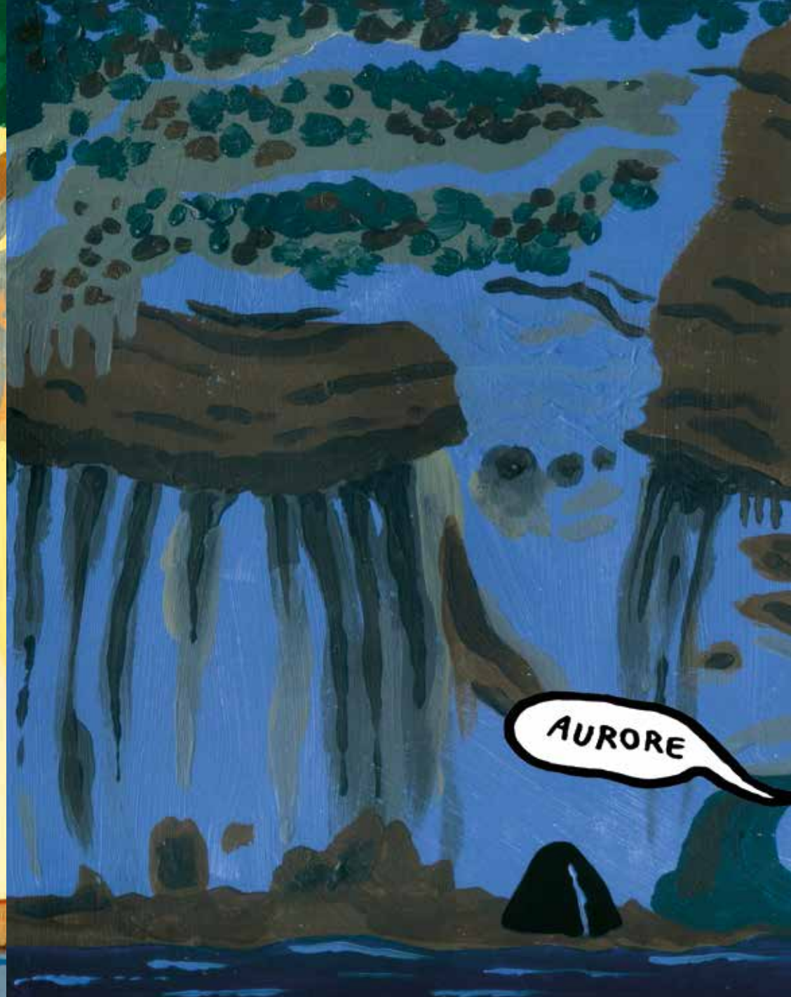
À nouveau, elle s'installe pour la nuit et elle entend...