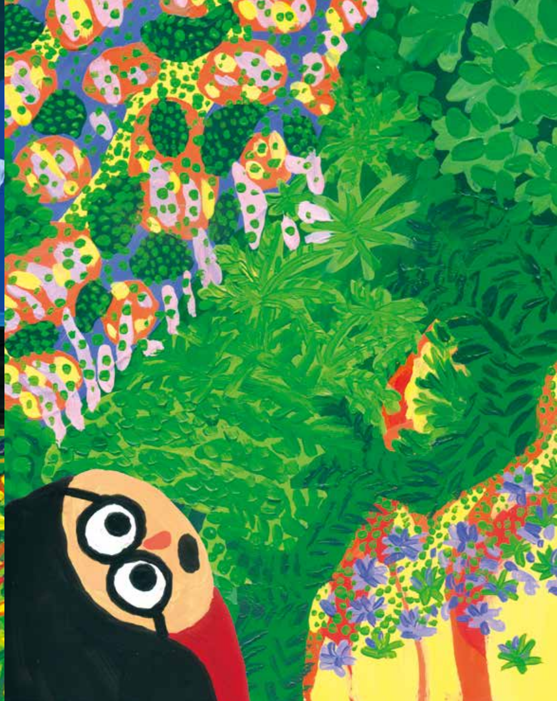
Aurore est éblouie. La végétation est luxuriante. La lumière vient caresser les plantes et colorie la montagne