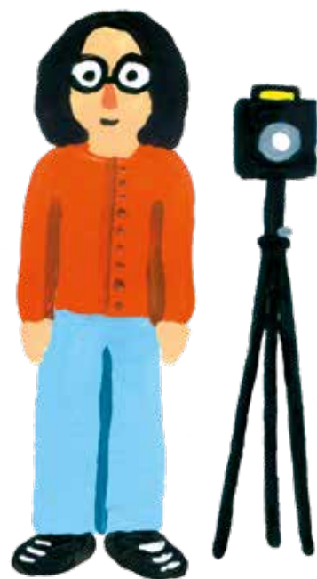
Aurore Bagarry, photographe

Ce livre, initié par le Centre d'art GwinZegal, est le fruit de la rencontre entre la photographe Aurore Bagarry et l'autrice et illustratrice Jeanne Verlhac.