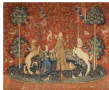
Tapisseries de Cinq Sens, La vue, musée de Cluny, 1500