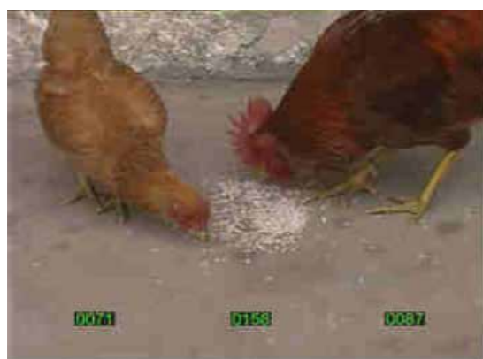
Lucky Family, Yang Zhenzhong, 2002, Shanghai