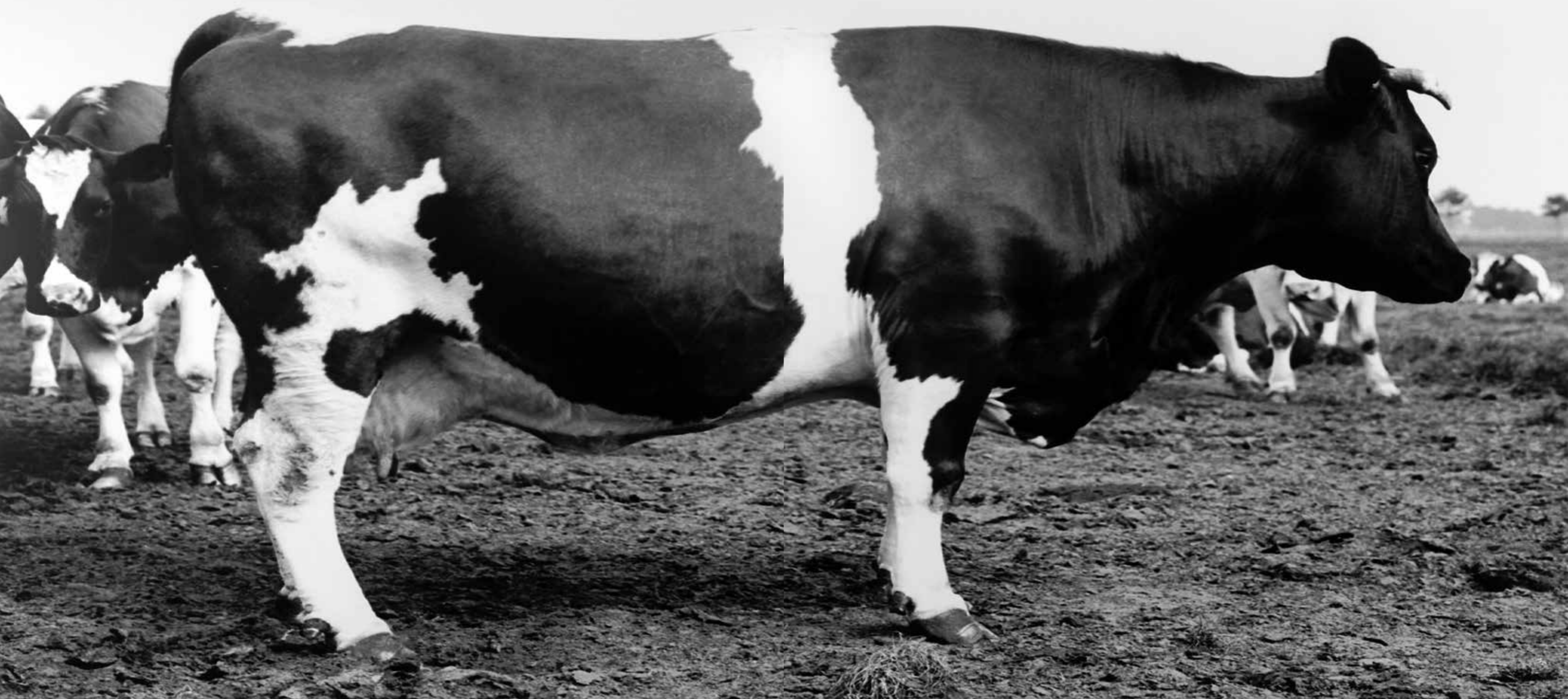
Angélique , Jef Geys, Bourg-Léopold (Belgique), 1934