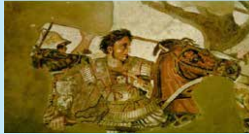
Musée archéologique national de Naples