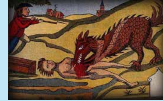
Bête du Gévaudan mangeant une femme, 1764