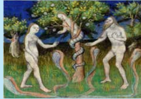
Guiard de Moulins, Bible historique, Le péché originel , Paris, début du XV e siècle