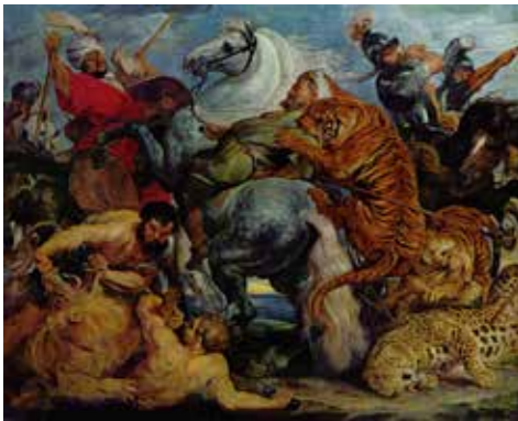
Petrus Paulus Rubens, La chasse au tigre, 1616