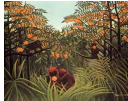
Douanier Rousseau, Les singes amoureux, 1895