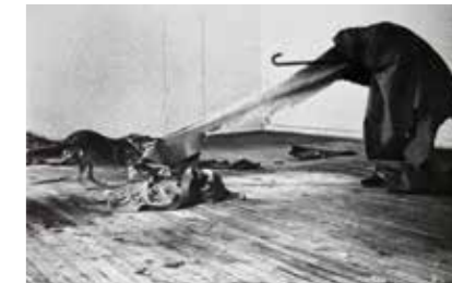
I like America and America likes me est une performance réalisée en 1974 par l'artiste allemand Joseph Beuys