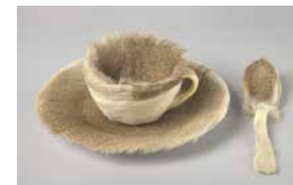
Meret Oppenheim, Object, Paris, 1936