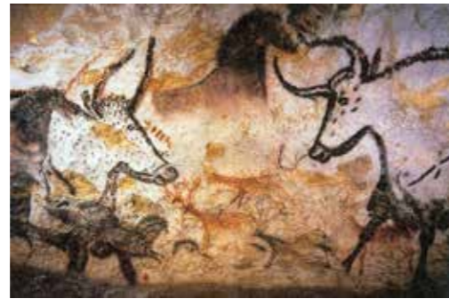
Salle des taureaux, grotte de Lascaux, Dordogne