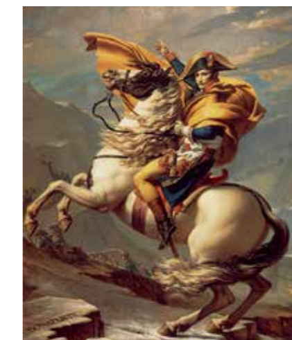
Jacques-Louis David, Bonaparte franchissant le Grand-Saint-Bernard, 1801