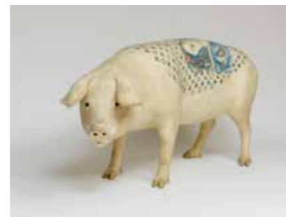
Wim Delvoye, Snow White (cochon naturalisé et tatoué), 2006