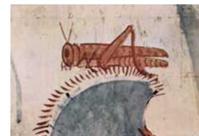
Sauterelle, tombeau de Horemheb, -1300