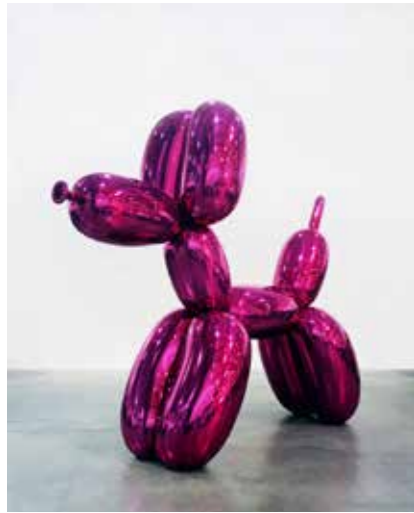
Jeff Koons, Balloon Dog, 1995