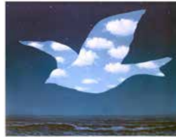
René Magritte, La promesse, 1950