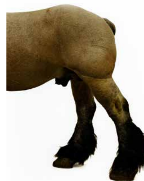
Sans titre, Éric Poitevin, Longuyon, 2000