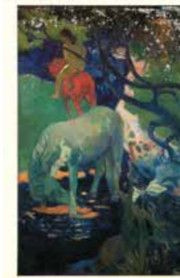
Paul Gauguin, Le cheval blanc, musée d'Orsay, 1898