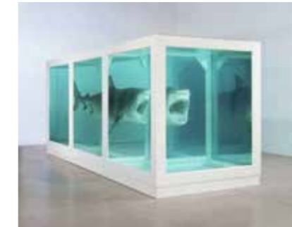
Damien Hirst, The Shark, 1991