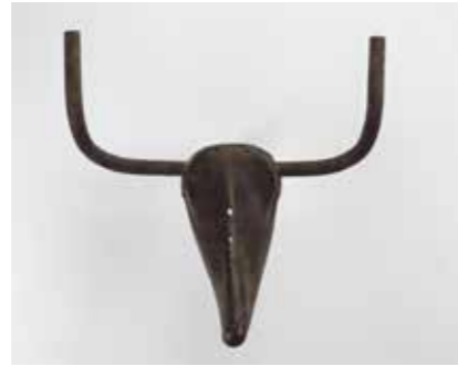
Pablo Picasso, Tête de taureau, 1942