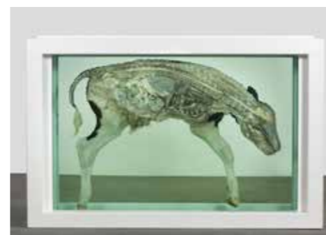
Mother and Child (Divided), Damien Hirst, 1993.