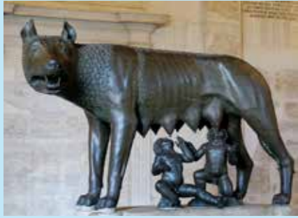
Musée du Capitole