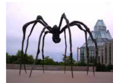
Louise Bourgeois, Maman, sculpture, musée des Beaux-Arts du Canada, Ottawa, 1999