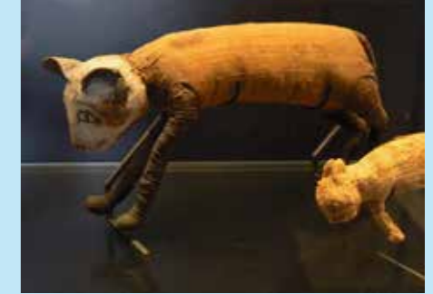
Momie de chat au musée du Louvre.