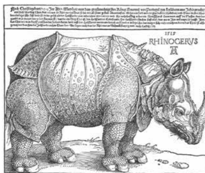
Albrecht Dürer, Le rhinocéros, 1515