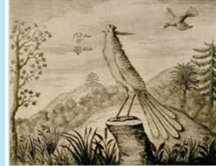
Fenghuang, le phénix chinois Dessin d'un Fenghuang datant de l'an 1664