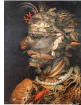
Giuseppe Arcimboldo (1527-1593), Portrait aux poissons et aux coquillages