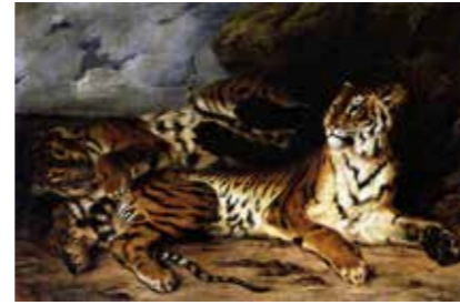
Eugène Delacroix, Jeune tigre jouant avec sa mère, musée du Louvre, vers 1831